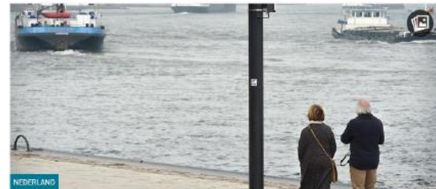
Een sensor opgehangen aan een lantaarnpaal meet de uitstoot van afmerende schepen. (beeld Marcel van den Bergh)